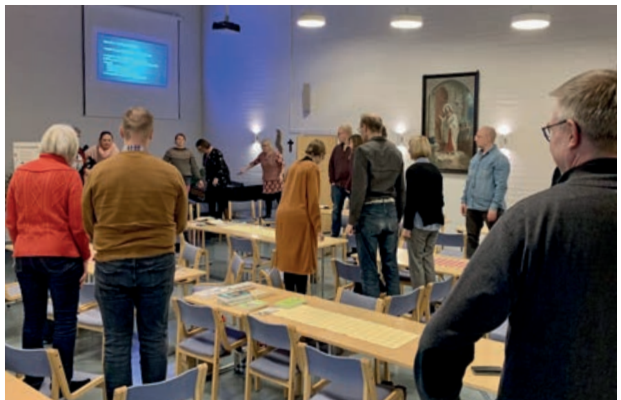
Oriveden seurakunta on mukana Elinvoimaa yhteisöllisyydestä -hankkeessa.

Syksyn mittaan olemme olleet yhteydessä useisiin seurakuntiin, jotka halusivat kehittää yhteisöllisyyttä koko alue seurakunnan laajuisesti. Vastauksena tarpeeseen olemme kehittäneet Elinvoimaa yhteisöllisyydestä -konseptin. Sen idea on käynnistää seurakunnassa kahden vuoden mittainen kehityshanke, jonka tuloksena seurakunnan toimintakulttuuri ottaa aimo harppauksen kohti yhteisöllisyyttä. Konsepti koostuu yhteisövalmennuksesta, yhteisistä työskentelyistä työntekijöiden ja luottamushenkilöiden kanssa sekä mentoroinnista. Hankkeen taustaksi seurakunnassa tehdään räätälöity suunnitelma sekä ns. SLK-tutkimus, joka antaa dataa kehittämisen tueksi. Ensimmäisten seurakuntien kanssa on jo sovittu hankkeen käynnistämisestä vuoden 2023 aikana. Lisätietoja verkosta: www.hengenuudistus.fi/kokosrk .