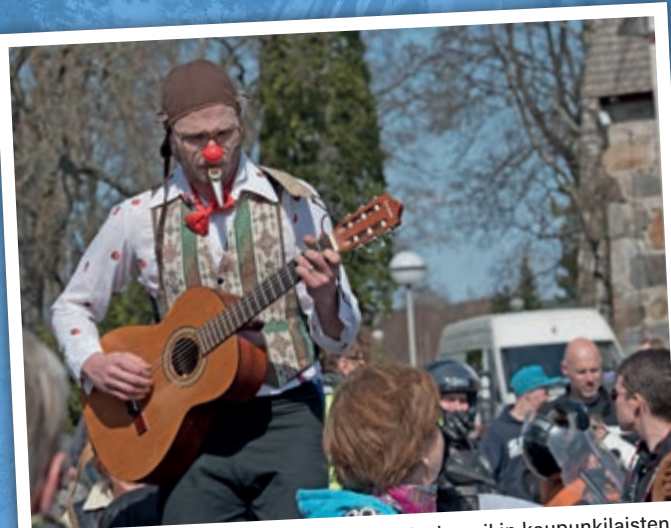
Lempäälässä niin seurakuntalaiset kuin laajempikin kaupunkilaisten joukko kerää vapputapahtumalla varoja Kimbilioon.