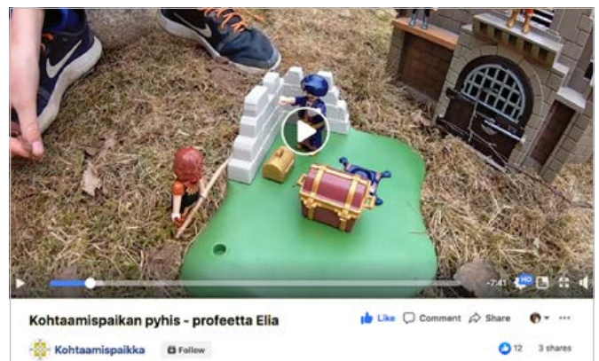
Lahden Kohtaamispaikassa pienimpien lasten pyhis sisältyi aikuisten videotapaamiseen.