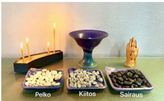
Tuomasmessun rukousaltarit siirrettiin nettisivulle.

Vuorovaikutteisissa tilaisuuksissa paluuta saadaan suoraan katsojilta ja se todistaa, että striimien seurajista osa ei ole ennen