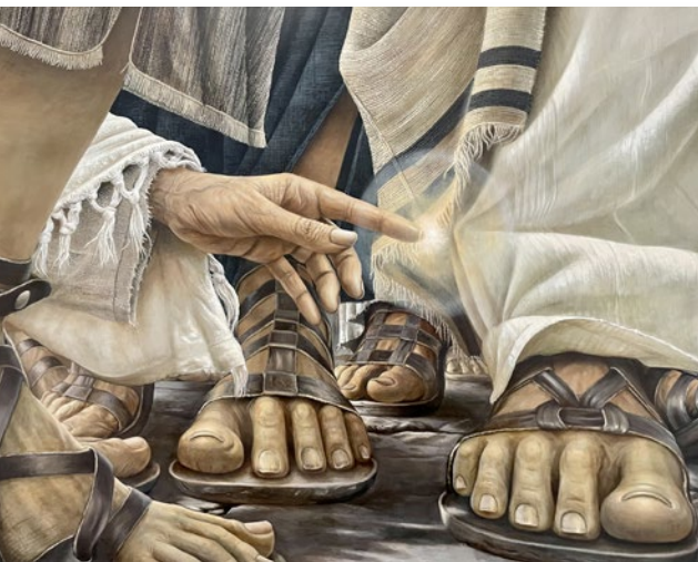
“Uskosi on parantanut sinut”, sanoi Jeesus naiselle, joka koski hänen viitan tupsuaan.

Kuva: Daniel Cariolan murallista ”Encounter”.