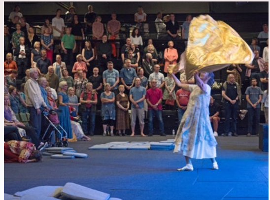
Ylistykseen osallistuttiin luovin tavoin.