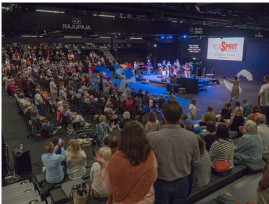
KesäSpiritiä vietettiin Lempäälän Ideaparkissa kuudennen kerran.