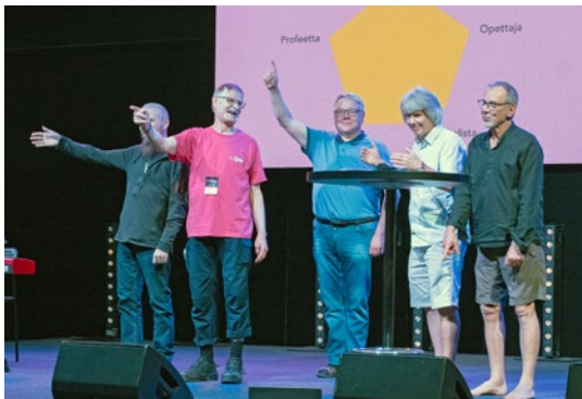
Viisi palvelutehtävää osoittavat eri suuntiin mutta yhteiseen missioon.

Profeetta kuuntelee Herraa ja tuo hänen tahtoaan julki pystysuunnassa vaalien suhdetta Jumalaan ja kutsuen mielenmuutokseen sekä vaakasuunnassa vaalien suhdetta ihmisten kesken ja kutsuen oikeamielisyyteen ja oikeudenmukaisuuteen. Profeetoille tyypillinen kysymys kuuluu: oletko kysynyt Jumalalta?