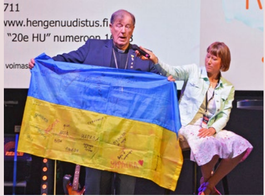
Kolehdeista osa lahjoitetaan Ukrainaan seurakuntien hengelliseen ja humanitaariseen työhön.